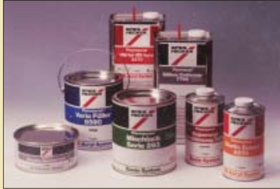
Utvalg av produkter som brukes til billakking.

Løsemidler er flytende stoffer som løser opp faste stoffer, og som brukes når det ikke er mulig å bruke bare vann. De kan være uorganiske, som f.eks. syrer og lut, eller organiske, som f.eks. white spirit, etanol, xylen og etylbenzen. Det er de organiske løsemidlene som kan forårsake løsemiddelskader. De uorganiske gir etseskader. Det anbefales alltid å bruke vannfortynnbare produkter der dette er mulig.